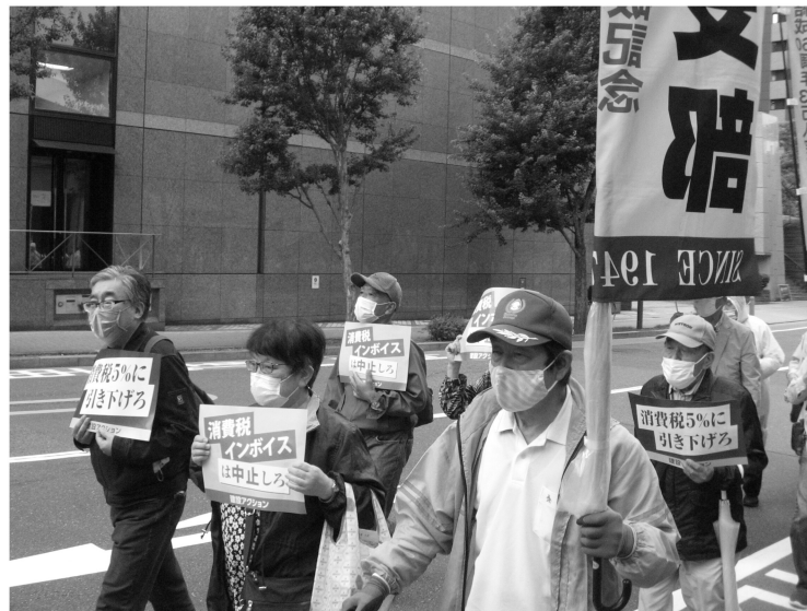
消費税減税、インボイス中止求めてデモ行進

フリーランスの方からは切実な発言があり共感できました。インボイス制度が始まると年間売上一千万円以下の零細業者・個人事業者は消費税免税ではいられなくなるにも関わらず制度の実態がまるで知られていないのは大問題だと感じました。またこれは実質増税なのです。本日にイ