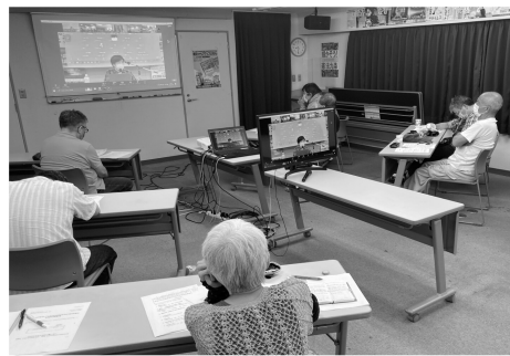
憲法25条を改めておさらい

コロナ感染の拡大もいくらか収まり始めた春先から、組合活動も少しずつ再開しています。組合では6月をくらしと仕事と憲法を守る運動をすすめる月間として、10日