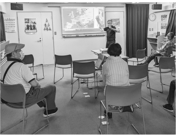
ロシアとウクライナの関係を説明

現状が説明されました。そして映画の鑑賞後は会場を沈黙が覆いまた。やはり戦争の不条理さ、切なさに心揺さぶられ、淡々と繰り返される日常生活がどんなに大切であるのか、平和のありがたさを実感しました。この平和を維持していくためには、まわりに流されることなく、しっかりとした考えを持つこと、日本には平和憲法9条があります。平和憲法を学び大切