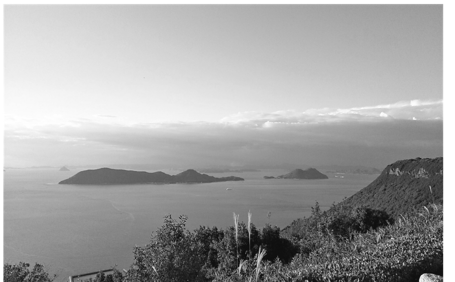
屋島国立公園の高台から瀬戸内海を眺める

を買いホテルの部屋飲 みで済ませた。 翌日の早朝はかなり気 温が低かった。持って きた下着を何枚も重ね て寒さをしのぎ、バイ クを走らせた。無事に 徳島港に着き、今回の 旅の走行距離を調べて みると1200キロに 達していた。12泊した ため、毎日100キロ 走った計算になる。20 万円くらいの予算を見 込んでいたが、2万円 ほど残った。各所がか なり飲んだ割には安く あがった。 お土産を買う時間が あまり無かったため、 次回はもう少しのんび りとした旅程を計画し ようと思う。 終わり 松が谷分会 A・I