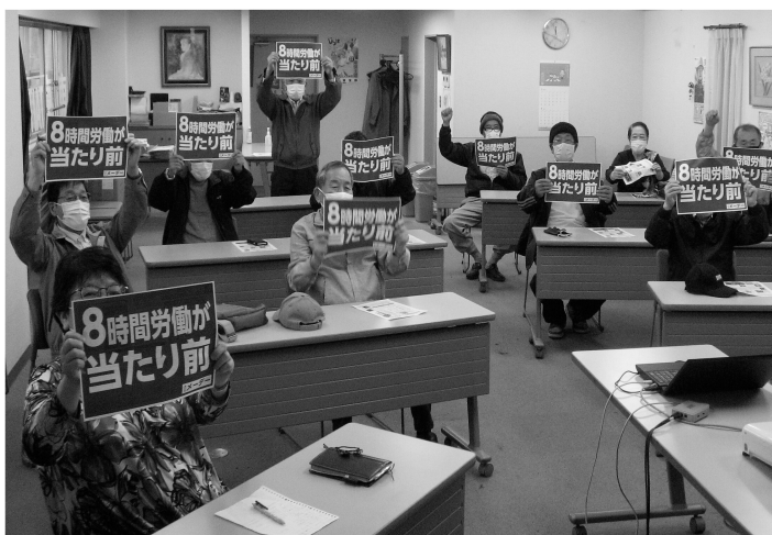
8時間労働をみんなでアピールします

5月1日にメインデーが行われ、台東支部では会館3階でオンライン配信による参加となりました。14人が集まり、スクリーンからの訴えかけに耳を傾けました。メイン会場の代々木公園は、現地で3年振りに人数を制限しての開催でした。