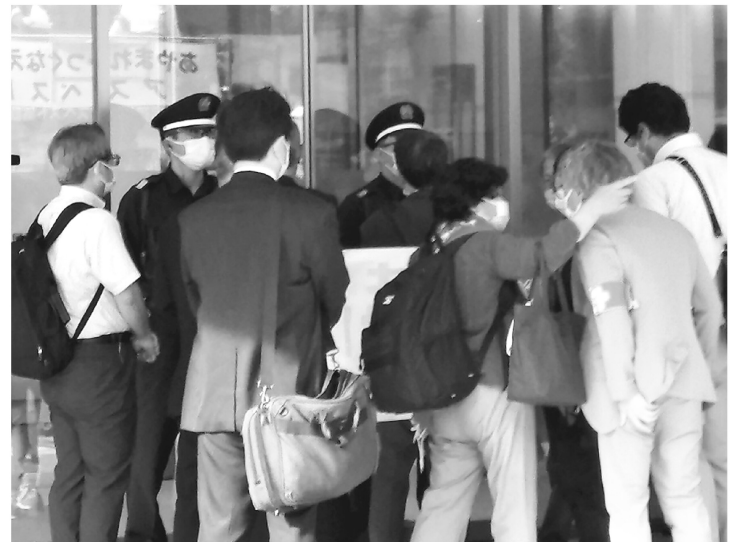
ニチアス社は要望書の受取りに応じなかった

野音での集会后、参加者は二手に分かれ、経済産業省前行動と被告建材メーカーであるニチアス本社前抗議行動を行いました。私たちが台東支部は、ニチアス本社を人の輪で囲み要望書を提出する行動に参加しましたが、ニチアス側は誰ひとりでもきません。出入り口にはガードマンが立っているだけです。ニチアス本社前への抗議行動へ行くのは今回で3度目ですが、ニチアス側はまだまだ誰ひとり出てきたためしはありません。建材メーカーの非は判決により確定しているにもかかわらず、謝罪表明もなければ和解金の交渉にすら応じていないのです。無い袖は振れないと思っているのでしょうか。