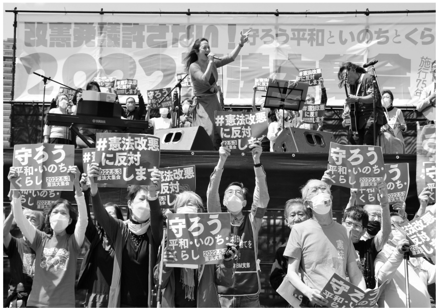
改憲に反対、平和・いのち・暮らし守ろう

五月三日は憲法記念日、日本国憲法施行から75年を迎えました。有明防災公園にて3年ぶりに開かれた憲法大集会は1万5千人が集集し、「今こそ憲法を守れ」と声を合わせました。 手作りのプラカードを掲げる人、音楽でアピールする団体、何やら個性的な衣装をして自転車で走り回っている人など様々な参加の仕方があり、改憲反対への想いが伝わってきました。 国民の尊い犠牲の末、た「お国のため」などの2度と戦争の惨禍を起かさせまいと誓い、日本国憲法を定めたのに、思いもよらずこの決意を捨て去って、昔よりも兵器も核も良い訳はない」と、弁護士の方がスピーチしていました。確かに戦争体験をした人たちにあって「国を守るため」と言われても心には響かず、それどころか 五月三日は憲法記念日、日本国憲法施行から75年を迎えました。有明防災公園にて3年ぶりに開かれた憲法大集会は1万5千人が集集し、「今こそ憲法を守れ」と声を合わせました。 手作りのプラカードを掲げる人、音楽でアピールする団体、何やら個性的な衣装をして自転車で走り回っている人など様々な参加の仕方があり、改憲反対への想いが伝わってきました。